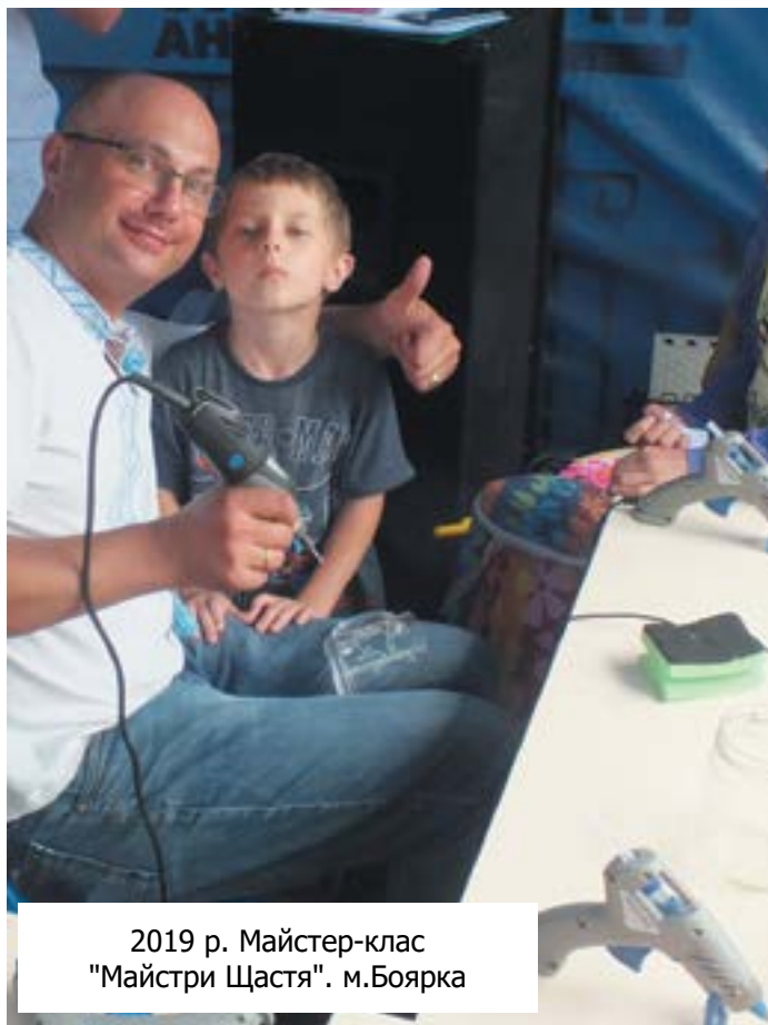
2019 р. Майстер-клас "Майстри Щастя". м.Боярка