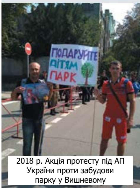
2018 р. Акція протесту під АП України проти забудови парку у Вишневому