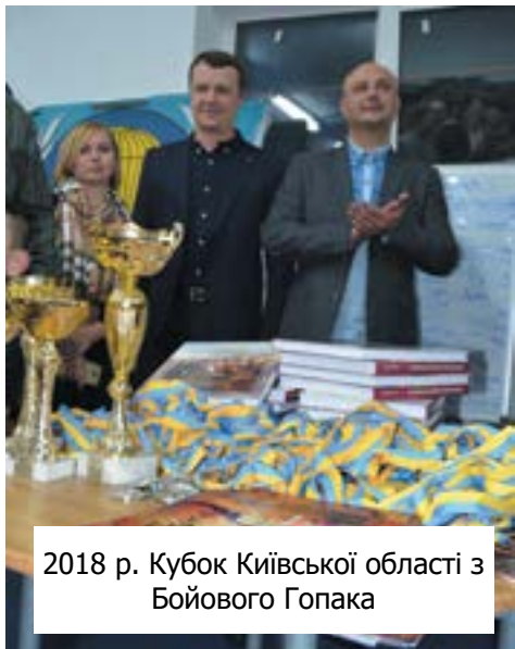
2018 р. Кубок Київської області з Бойового Гопака