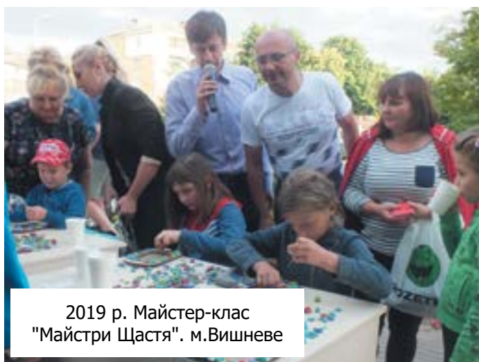
2019 р. Майстер-клас "Майстри Щастя". м.Вишневе