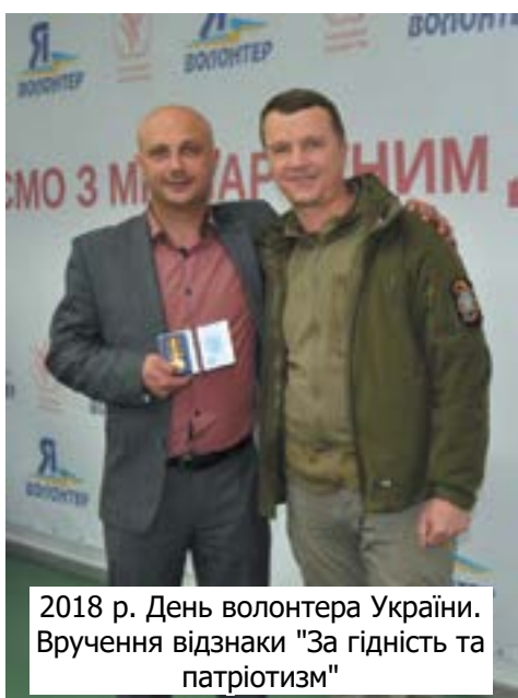
2018 р. День волонтера України. Вручення відзнаки "За гідність та патріотизм"