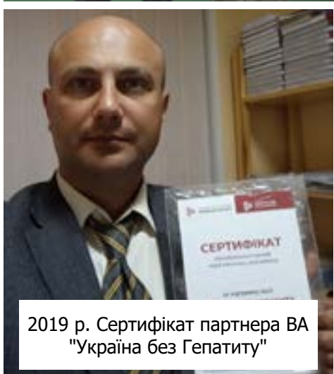
2019 р. Сертифікат партнера ВА "Україна без Гепатиту"