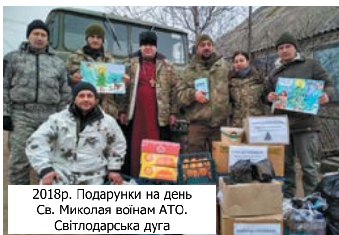
2018р. Подарунки на день Св. Миколая війнам АТО. Світлодарська дуга